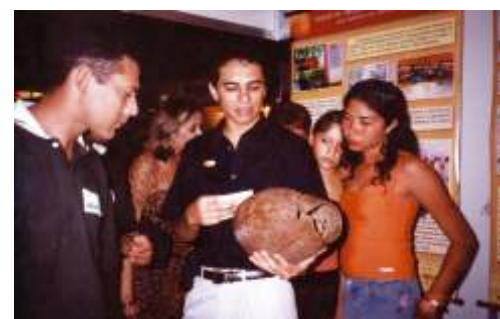
Arqueólogo da equipe técnica do MAX complementa dados técnicos para participantes de Workshop no Ceará