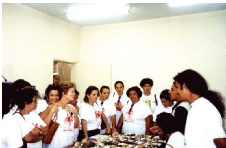
Visita de docentes ao laboratório do MAX