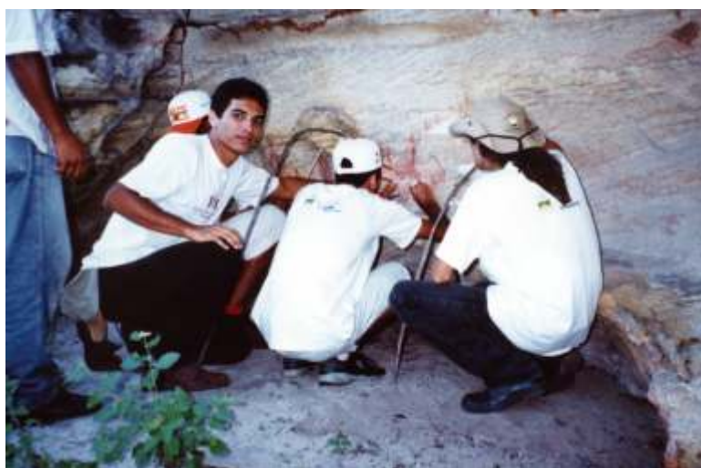
Férias arqueológicas: alunos de graduação em estudos de sítio de registro rupestre

Sem dúvida, a Ação Educativa tem sido um instrumento fundamental para a valorização do MAX enquanto um referencial de nossa cultura regional e enquanto espaço de discussão e de aprendizagem a partir de seu acervo expográfico, e da dinâmica de conteúdo que dele emana, imprescindível aos estudos da educação patrimonial.