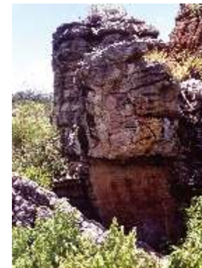
Sítio de registros rupestres em paredão rochoso, na fazenda Mundo Novo/SE