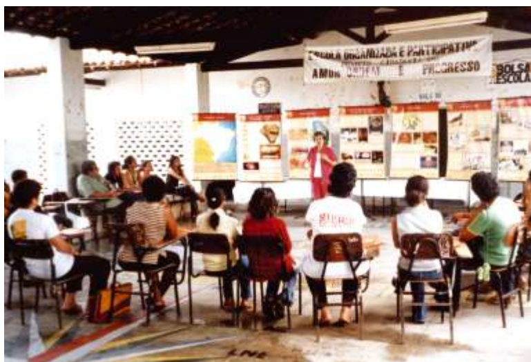
sensibilização no Colégio Estadual Poeta José Sampaio Carmópolis/SE