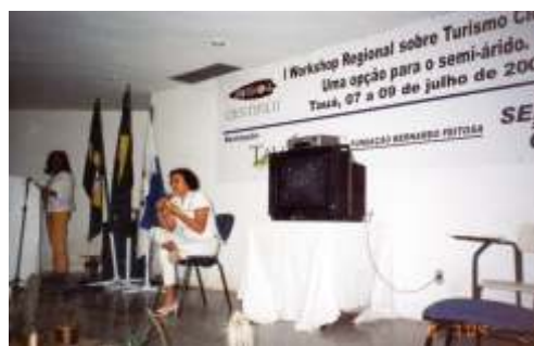
Pronunciamento da Gerente de administração e Finanças na abertura de Workshop no Ceará

Além da participação no Workshop, o MAX esteve também presente na Feira de Negócios da Região dos Inhamuns - FENERI, promovida pelo SEBRAE, sendo montado um stand com a exposição da ação educativa, composta por banners e réplicas dos materiais arqueológicos encontrados em Xingó. Centenas de pessoas visitaram a exposição.