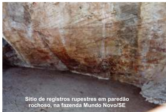
Sítio de registros rupestres em paredão rochoso, na fazenda Mundo Novo/SE

A exposição Grafiteiros de Ontem: registros rupestres em Xingó reproduzirá cenograficamente a região, destacando técnicas de pintura rupestre e, entre os matacões, alguns painéis fotográficos vão identificar pinturas do paleoíndio.