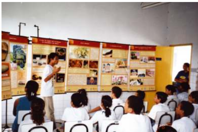
Vivência pedagógica na EMSF Des. José Sotero Vieira Melo Rosário do Catete/SE

Leve a Ação Educativa do MAX para sua escola. Solicite a presença da equipe pelo telefone (79) 212-6448 ou 212-6453.