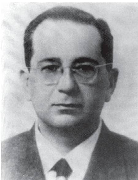
Figura 1: Artur Ramos, 1903-1949

Fonte: Relembrando Artur Ramos. Sapucaia, 2003. (Acervo da Fundação Artur Ramos, Maceió)