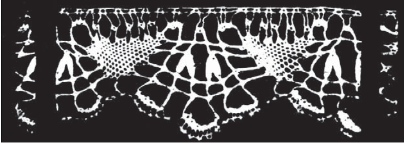
Figura 4: Renda de Bilro produzida em Sergipe na primeira metade do século XX.

Fonte: Renda de Bilro: Coleção Museu Artur Ramos. Girão, 1984.