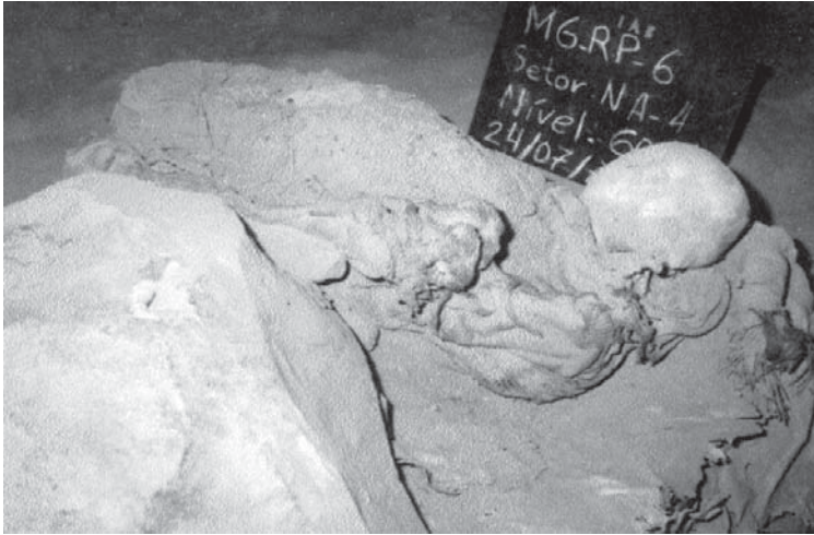
Figura 4: Enterramento 10 - primário parcialmente mumificado com vasto comportamento funerário. Horizonte Horticultor

cestos, se secundários, sendo, então, depositados em covas razoavelmente profundas, forradas por vegetais diversos, especialmente folhas de palmáceas. Alguns enterramentos, também foram recobertos por esse