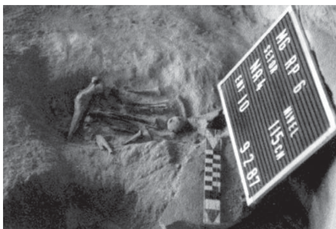
Figura 7: Enterramento 94, 94 A - Secundário cremado. Horizonte Caçador-Coletor.

No horizonte horticultor, observou-se a recorrência dos enterramentos mais importantes, tais como o 10 e o 12, depositados no fundo da Gruta, reafirmando-se possivelmente a idéia de maior proteção. A grande maioria, no entanto, está na área intermediária cuja localização protegeria a todos da ação das chuvas, do sol, do vento e dos animais.