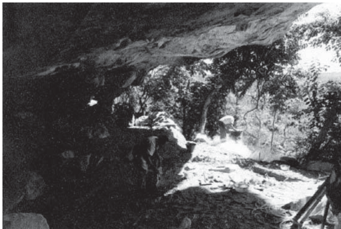
Figura 3. Área interna da Gruta, início das escavações (1976)

enterramentos e cento e trinta e oito (138) indivíduos, correspondendo a 72,5% e 78,5% respectivamente.