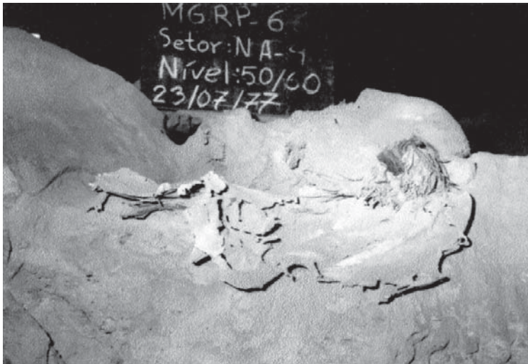
Figura 5: Detalhe do enterramento 10 - Fragmentos de couro, tecelagem e extremidade de uma trança com cabelo