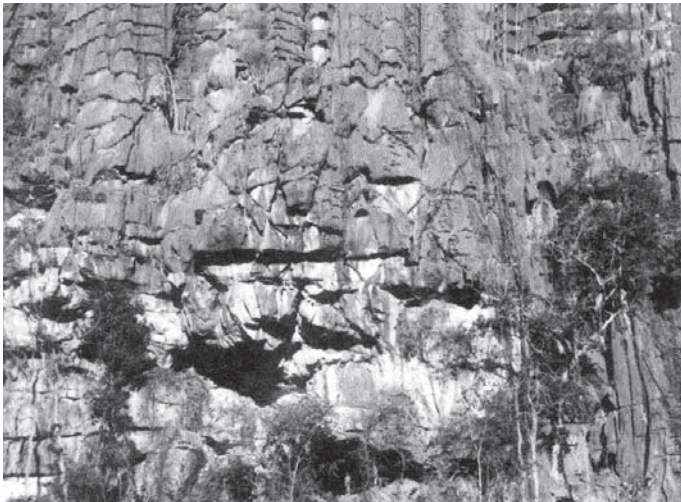
Figura 2. Entrada da Gruta do Gentio II

ocupacionais, devidamente associadas a dois horizontes culturais – um, mais antigo, de caçadores-coletores (camadas II, III e IV) e outro, mais recente, de horticultores (camada I) – cujas datações, que variam aproximadamente 10.000 a 7.000 AP e 3.500 a 400 AP, coadunam-se com os demais trabalhos de pesquisa já realizados na região. (FIGURA 3)