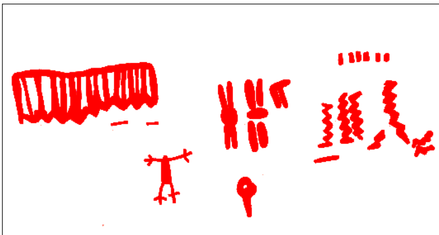
Figura 1 - Sítio nº 32