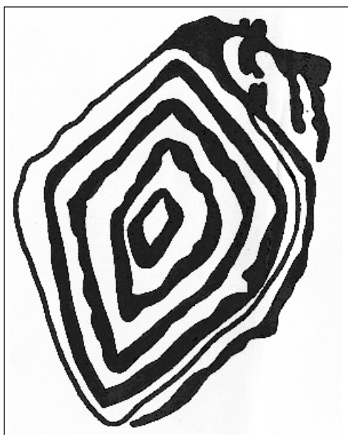
Figura 3 - Sítio nº 58