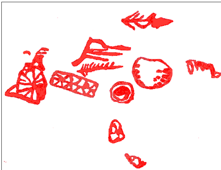
Figura 2 - Sítio nº 412