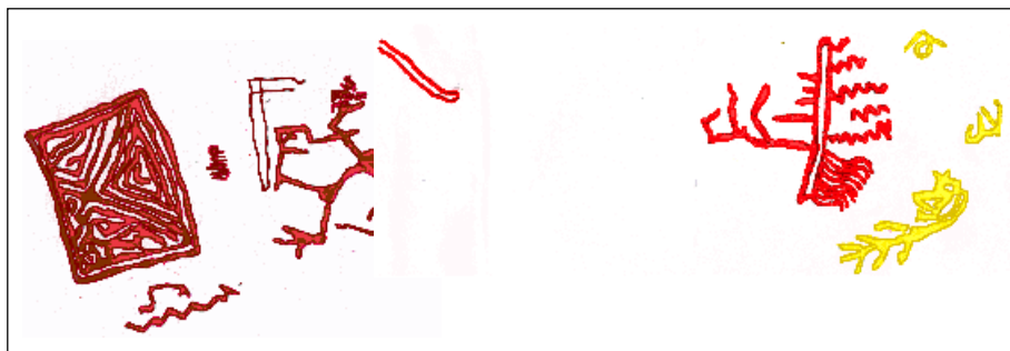
Figura 5 - Sítio nº 413