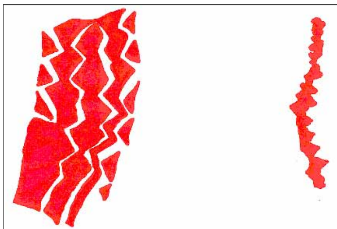
Figura 4 - Sítio nº 67